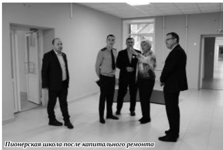
Пионерская школа после капитального ремонта

Алена Дудина Анастасия Мохнашина